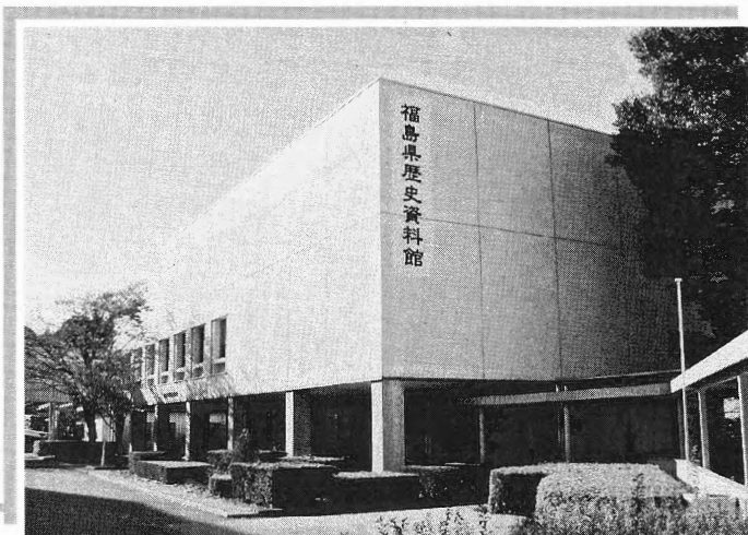
福島県歴史資料館